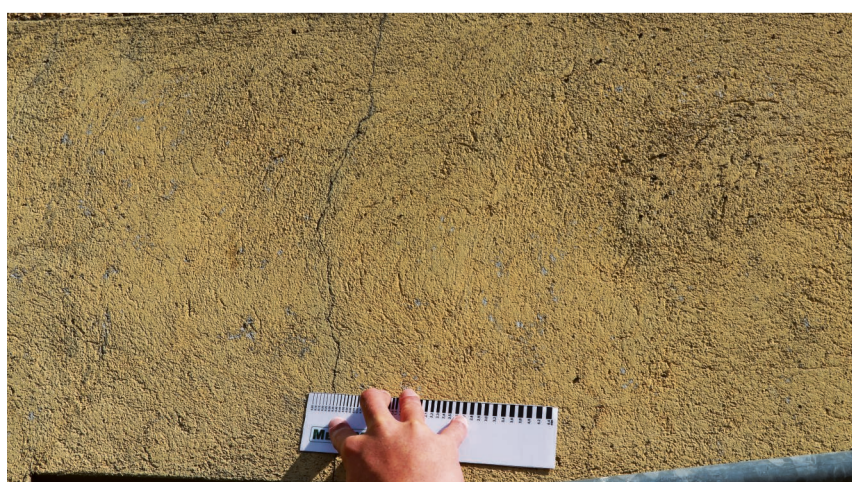
METRIX SA, PORRENTRUUY