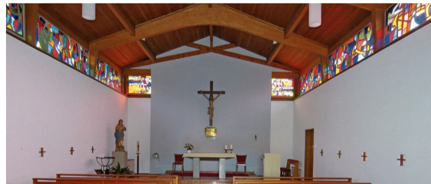
La chapelle de Berlincourt et ses vitraux d'Estèves fait partie des bâtiments présentant une «sensibilité accrue et une grande valeur» qui feront l'objet d'une attention particulière.

Près des deux tiers des propriétaires concernés ont requis un protocole de fissures pour leur bâtiment. À la fin août, les relevés étaient presque achevés à Boécourt et Glovelier. À Bassecourt et dans les villages avoisinants, ils se poursuivront jusqu'au mois de mars 2024. Le planning d'intervention, quartier par quartier, est envoyé par courriel aux propriétaires et est disponible auprès des communes concernées, ainsi que sur le site Internet du projet ( www.geo-energie-jura.ch/protocoles2023/ ).